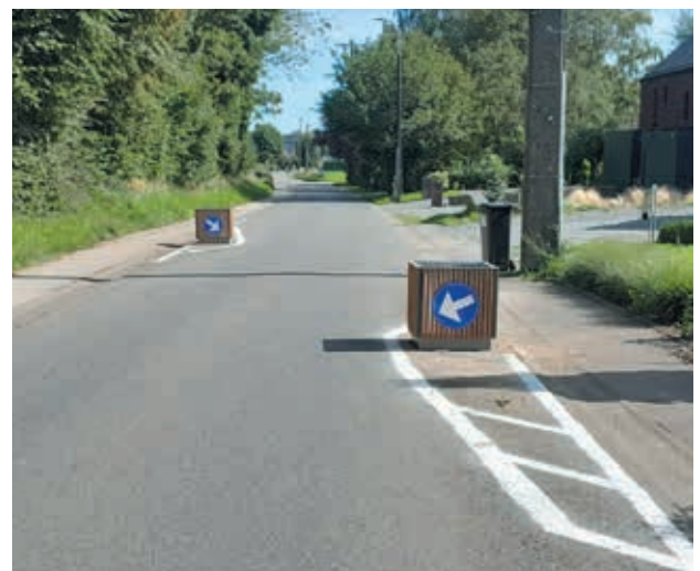
Placement de bacs à fleurs ralentisseurs à Fraiture