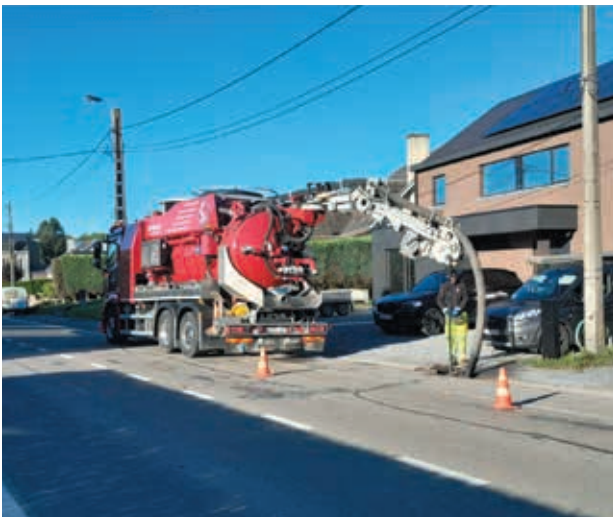
Curage et passage de la caméra dans les canalisations de la Rue du Centre