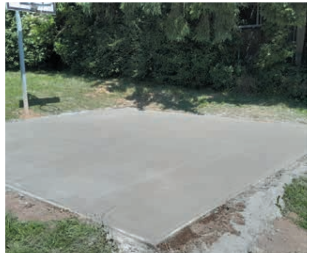
Réfection du terrain de basket sur la plaine de jeux de Scry