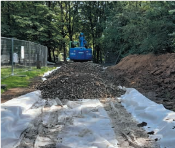
Début des travaux d'agrandissement de l'école communale