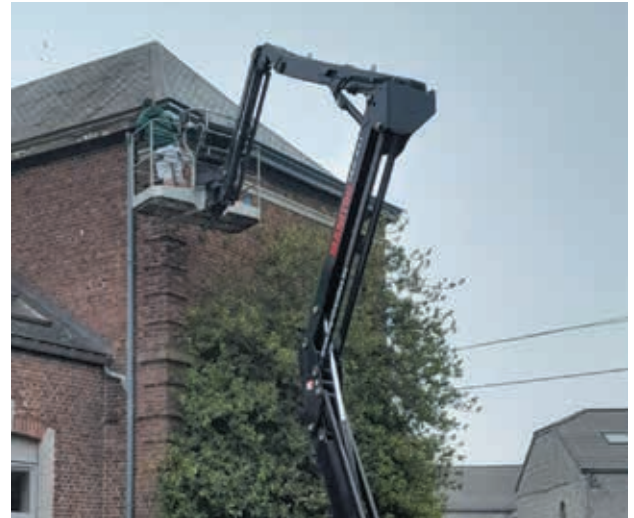
Peinture des corniches de l'Administration communale