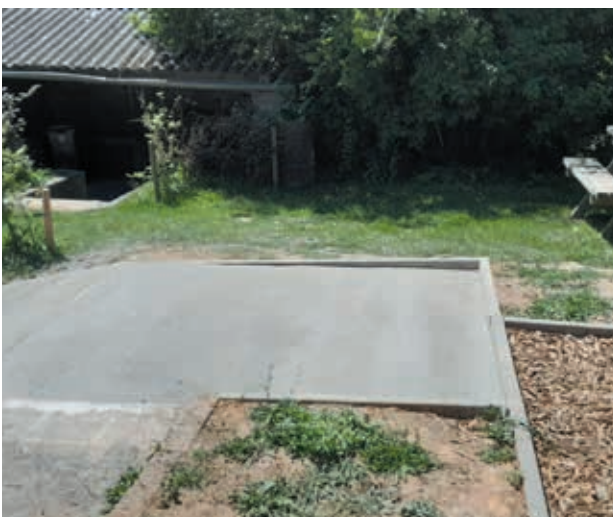
Création d'une rampe d'accès PMR à la salle communale de Scry